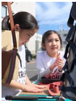
ワークショップもたくさん