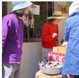
家族でピクニックにびったり！