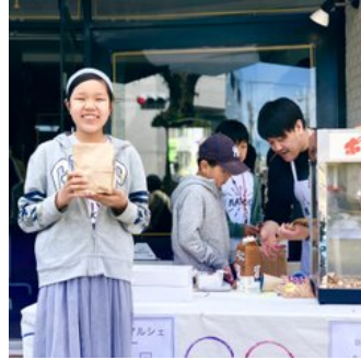
子供にも笑顔が溢れます