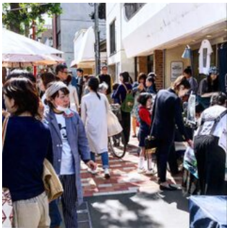
インテリアショップが並ぶ目黒通りをピクニック！