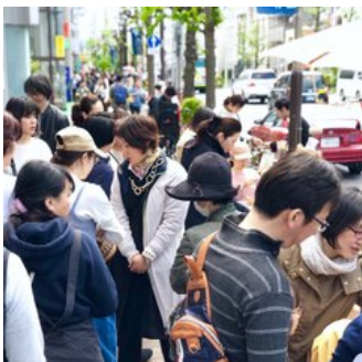
メグマル・キッズ募集中です！