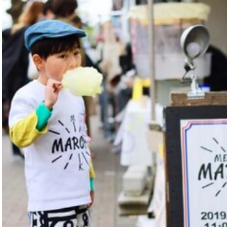
メグマル・キッズがわたあめを作ります!!