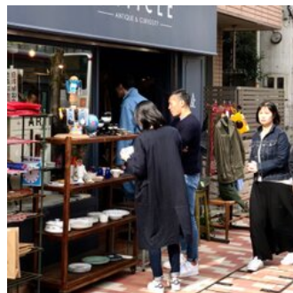
目黒通りのお店が軒先で蚤の市を開催