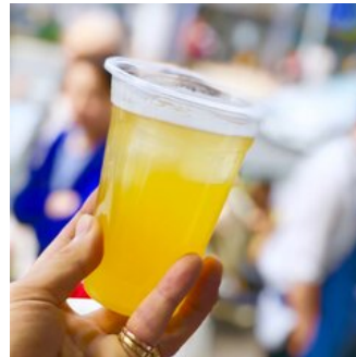
目黒マルシェでカンパイ!!