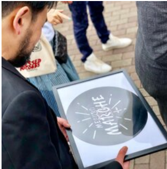
作家さんの目黒マルシェの作品