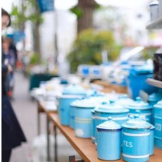
ヴィンテージやアンティークが並びます。