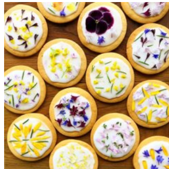
食欲の秋ということで食べ物も豊富