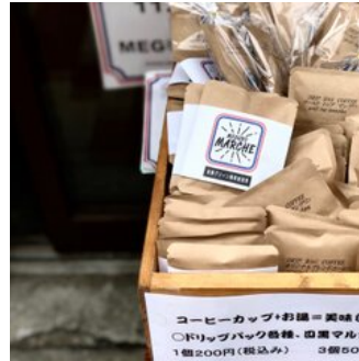
目黒マルシェブレンド!