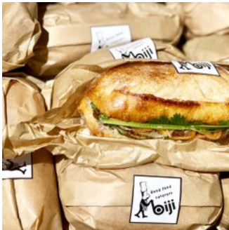
バインミーが海外のマルシェのように山積み