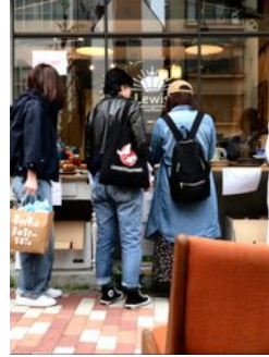
憧れの北欧の器も蚤の市でたくさん