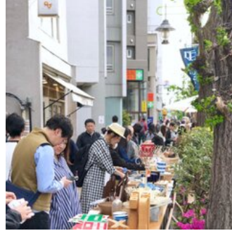
目指すは海外のマーケットの楽しさ