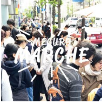
楽しい空気であふれています。