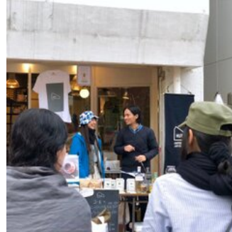
コーヒースタンドもたくさん出来ます