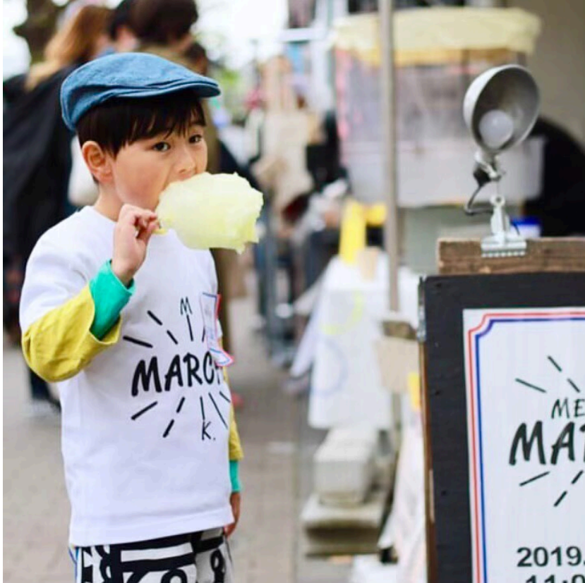
メグマル・キッズがわたあめを作ります！！

食欲の秋ということで、目黒だけでなく全国から名物も集合します。普段、目黒通りで青空市場を開催している「時間の市場(ときのいちば)」は、全国の農家さんとの企画を開催します。普段は農業を行なっている農家さんがこの日のために全国から集い、それぞれの田舎料理を振る舞います。養蜂場のオーナーが自分で搾ったはちみつを販売したり、東京ではなかなか見かけない地元の特産品を販売します。