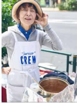
人気のチリコンカンは見ついたらラッキーです