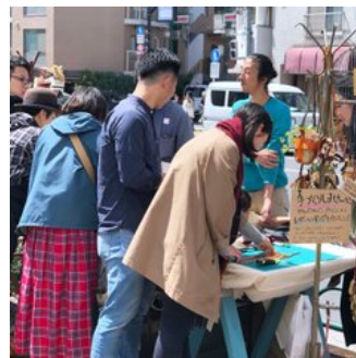
路上でのワークショップも大人気